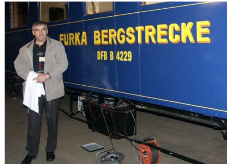
Der B 4229 mit seiner DFB-Bezeichnung bei der Wagentaufe

Die Wagenbezeichnungen setzen sich aus einem Typenschlüssel bestehend aus Buchstaben und einer Nummer zusammen. Die Typenbezeichnung – z.B. das B aus B 40 – ist genormt. Wenn ein Wagen von der DFB übernommen wird, wird sie deswegen beibehalten, sofern die Art des Wagens gleich bleibt.