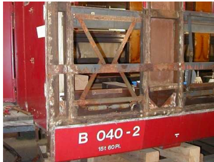
Die alte Nummer des B 4229, die er bei der LSE trug (ex Brünig C 829)