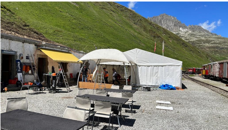
Nach einigem Hin und Her steht auch das Grillzelt vor dem Festzelt.