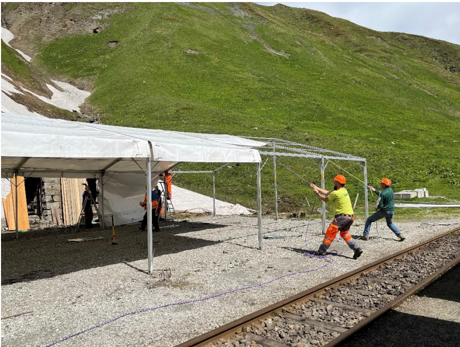
Mit vereinten Kräften werden eine Blachenbahn nach der Anderen eingefädelt und über das Gerüst gezogen.