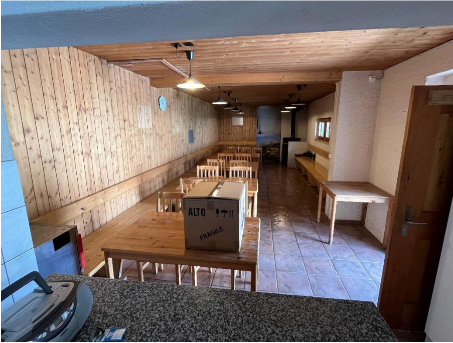
Die Gaststube ist bereit für die Gäste und das Personal.