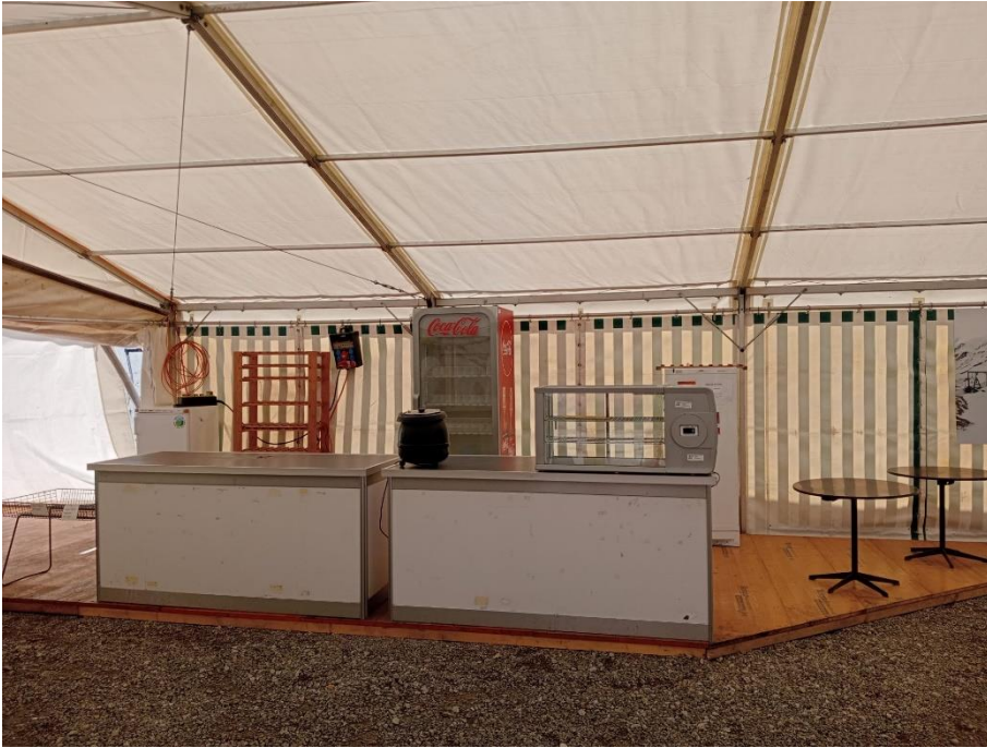
Die Essbar und ...