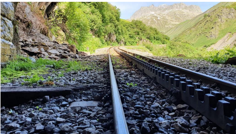
Nach Räumung des gelösten Felsmaterials aus dem Lichtraumprofil ist die Strecke wieder befahrbar. Der Schutt wird zu einem späteren Zeitpunkt mit einem Bagger geräumt.