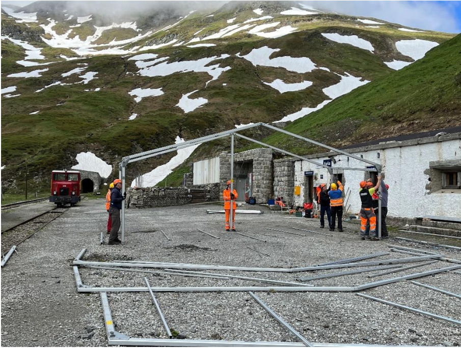
Montage des Gerüsts des Festzeltes Furka.