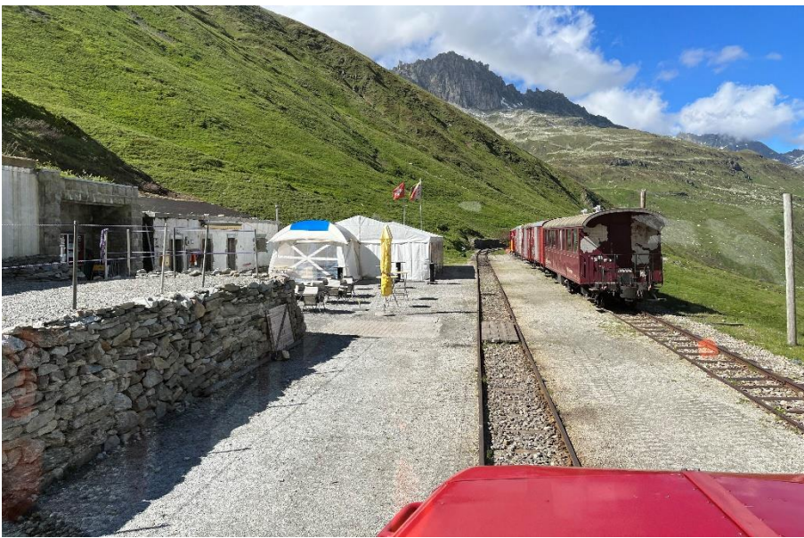
Nach sieben Stunden schliessen wir die Auswinterung der Station Furka ab und fahren mit der Tm 506 durch den Scheiteltunnel zurück nach Muttbach-Belvédère. Von dort fahren wir via Gletsch zurück nach Realp. In Gletsch holen wir die Kollegen der Sektion Innerschweiz ab, die beim Stopfen der Gleise geholfen haben. Diese wurden während des Totalumbaus vom Oktober 2021 eingebaut.