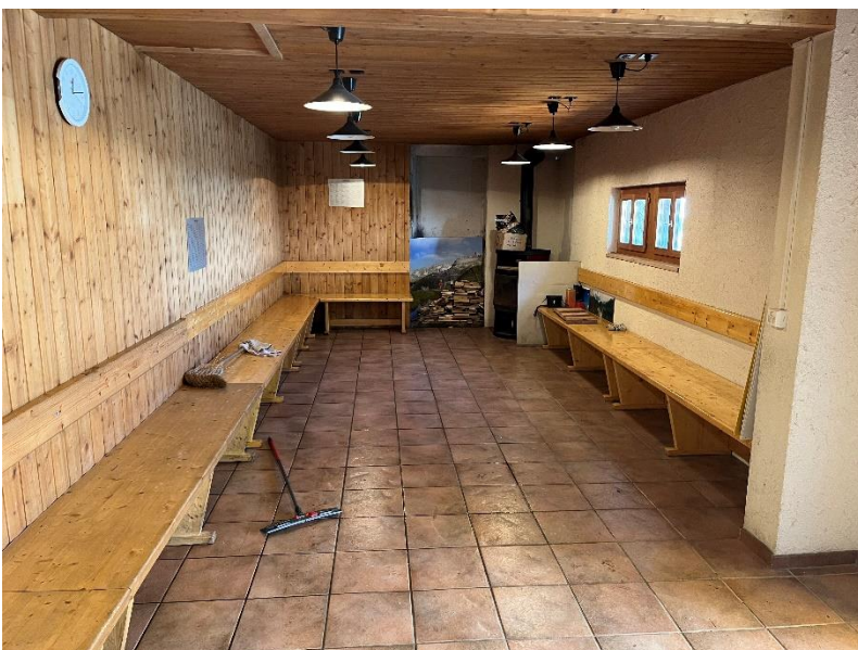
Nachdem alles Material aus der Gaststube ausgeräumt ist, wird der Boden gereinigt und feucht aufgenommen.