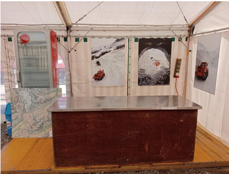
... die Kaffeebar im Festzelt.