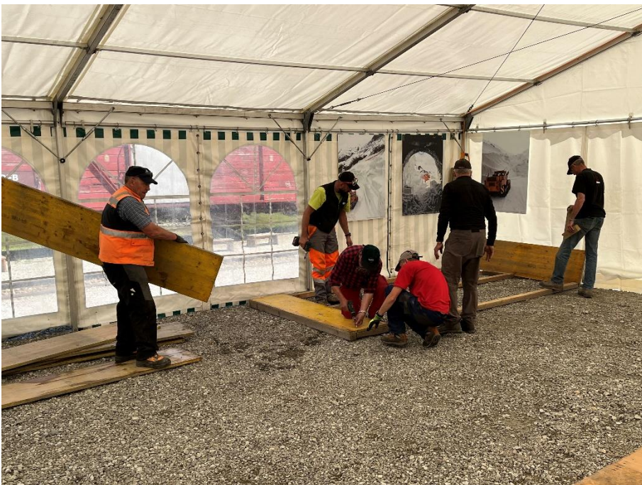
Montage des Holzbodens für die Ess- und Kaffeebar im Festzelt.