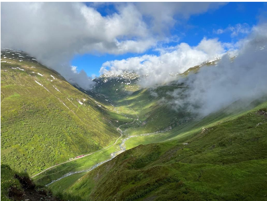
Tolle Morgenstimmung auf der Fahrt von Realp nach Muttbach-Belvédère.